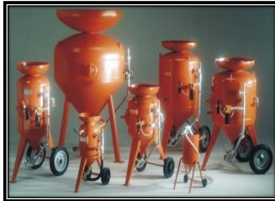
JATEADORES DE AREIA