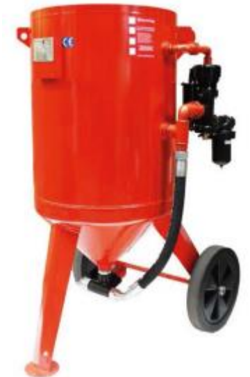
Com controle remoto

Jateadores de areia de diversas capacidades, de acordo com as necessidades de produção. Adequado para o tratamento de diferentes superfícies