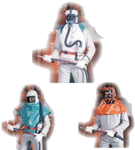
MÁSCARAS E CAPACETES

Sistemi di verniciatura industriale automatismi ed impianti