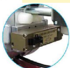
Valvola d'inversione innovativa