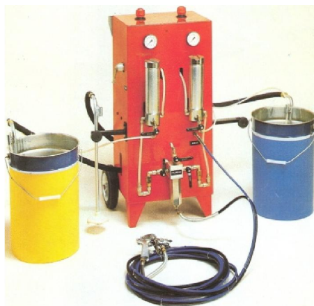
Sistema statico di miscelazione