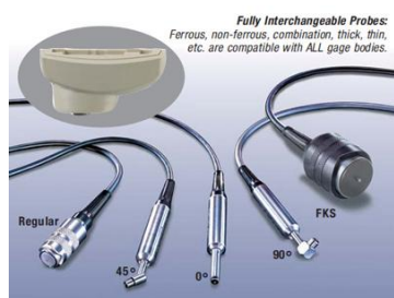
Fully Interchangeable Probes: Ferrous, non-ferrous, combination, thick, thin, etc. are compatible with ALL gage bodies.